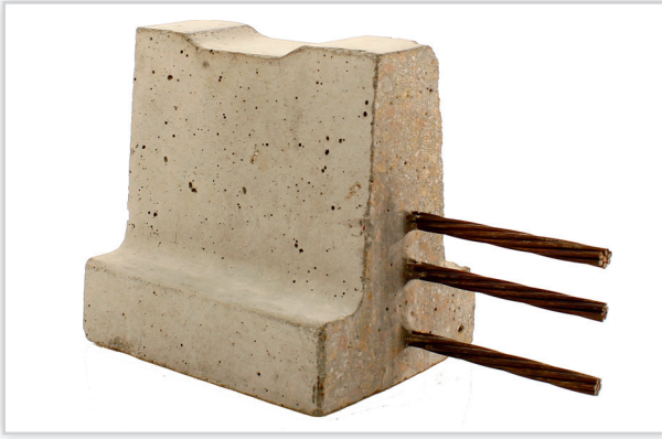
Belki 110-130. Materiał: beton C 50/60. Zbrojenie: stal klasy 2060 MPa. Wymiary (dł./wys./szer.) [mm]: 1-10/110-130/98-105. Rozstaw osiowy [mm]: od 59 do 60.