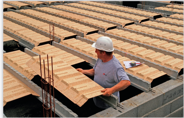
Strop nad przestrzenią wentylowaną. Alternatywne rozwiązanie dla tradycyjnych podłóg na gruncie. Zalety: wentylacja przestrzeni podpodłogowych, eliminacja możliwości popełnienia błędów wykonawczych, zastosowane zamiast tradycyjnej posadzki na terenach gruntów spoistych to rozwiązanie łatwiejsze w wykonaniu i bardziej ekonomiczne.