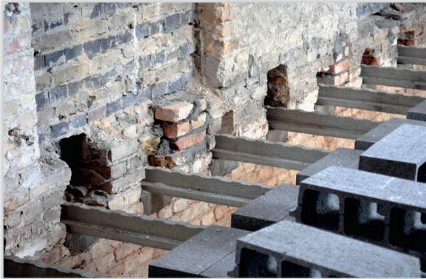
Systemy stropowe RECTOBETON i RECTOLIGHT. Stosowane przy renowacjach. Wymiana stropu charakteryzuje się: łatwością i szybkością montażu, lekkością konstrukcji stropowej – ciężar od 187 kg/m 2 , możliwy montaż bezpodporowy – nawet do 5,8 m, możliwość wykonania wieńca na pierwszym rzędzie pustaków, oparcie belek w gniazdach w ścianach.