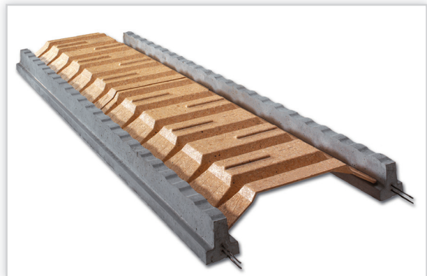
Rectolight. Wypełnienie: panele stropowe z drewna prasowanego. Długość elementu: 120 cm, zastępuje 6 pustaków. Wysokość stropu [cm]: od 16 do 26. Masa: 1 m 2 stropu od 190 kg. Klasyfikacja ogniowa: REI 60. Stosowany we wszelkich budynkach mieszkalnych i użyteczności publicznej, z zastosowaniem sufitów podwieszanych. Uzyskiwane rozpiętości w systemie Rectolight wahają się między 1,8 m do ponad 8,0 m. Łatwość w cięciu i wykonywaniu otworów sprawia, iż jest dopasowany do każdego projektu. Konstrukcja stropu może uzyskać ogniowość REI 60 (Badanie ITB nr 28818/11/Z00 NP).