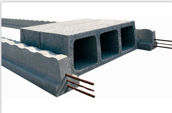
Rectobeton – wypełnienie pustaki z czystego betonu. Wysokość całkowita stropu [cm]: od 16 do 34. Masa: 1 m 2 stropu od 235 kg. Klasyfikacja ogniowa: od REI 60 do REI 240. Stosowany we wszystkich rodzajach budynków, na wszystkich kondygnacjach uzupełnieniem systemu są: zbrojenia przypodporowe, zgrzewane maty siatkowej oraz beton monolityczny wylewany na budowie.